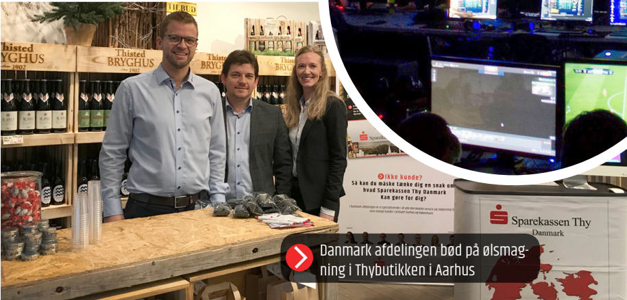
➤ Danmark afdelingen bød på ølsmagning i Thybutikken i Aarhus