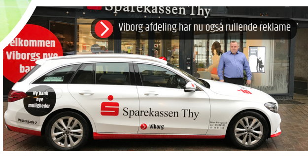
➤ Viborg afdeling har nu også rullende reklame