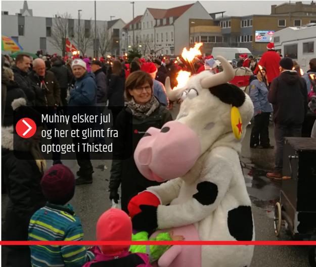
➤ Muhny elsker jul og her et glimt fra optøget i Thisted