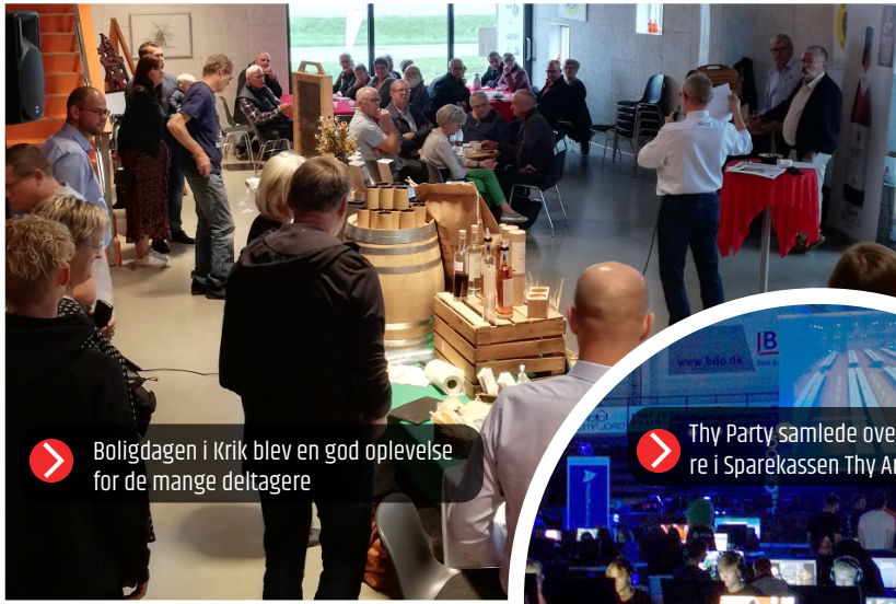
➤ Boligdagen i Krik blev en god oplevelse for de mange deltagere