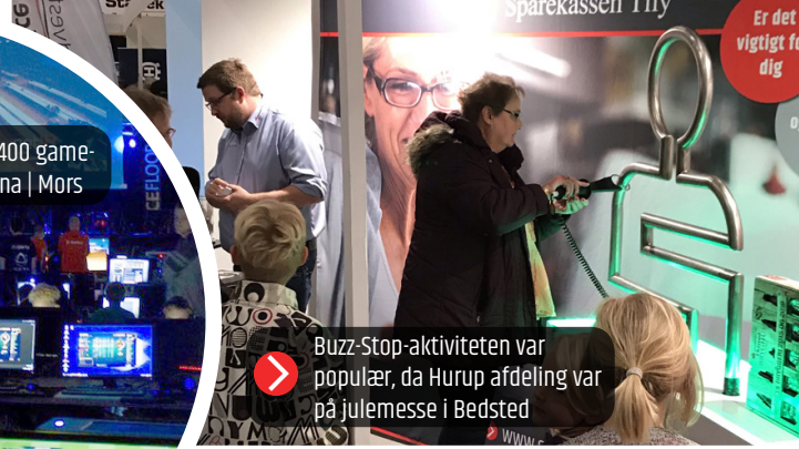
➤ Buzz-Stop-aktiviteten var populær, da Hurup afdeling var på julemesse i Bedsted