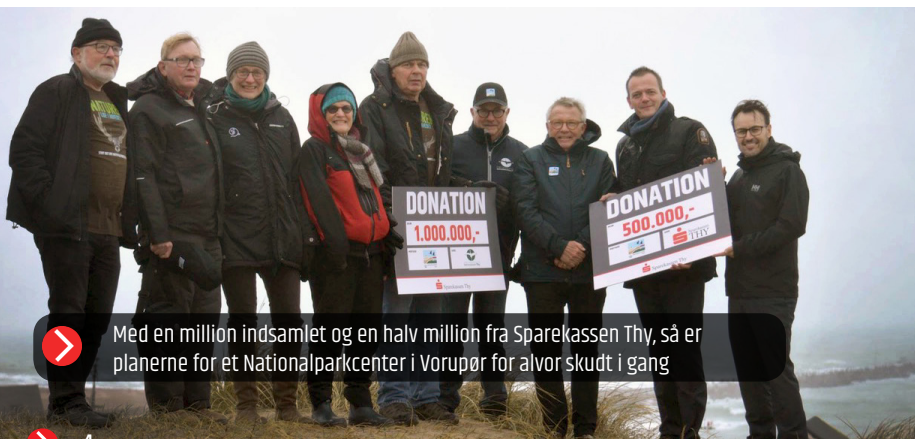
➤ Med en million indsamlet og en halv million fra Sparekassen Thy, så er planerne for et Nationalparkcenter i Vorupør for alvor skudt i gang