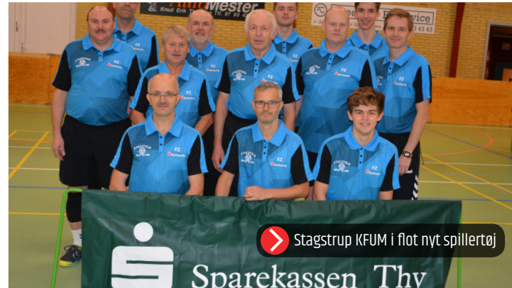
➤ Stagstrup KFUM i flot nyt spillertøj